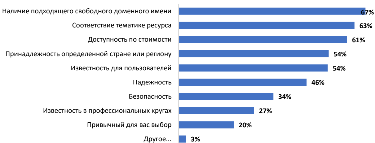
Диаграмма 5: Распределение респондентов по факторам, влияющим на выбор зоны для регистрации доменного имени

Среди факторов, важность которых при выборе доменной зоны для регистрации доменного имени отметили респонденты, наиболее значимыми для пользователей являются: наличие свободного доменного имени, соответствие тематике ресурса и доступность по стоимости. Каждый из этих факторов близок более чем 60% респондентов. Второе место делят принадлежность к определенной стране или региону и известность для пользователей, они являются значимыми для 54% и 53% респондентов соответственно.