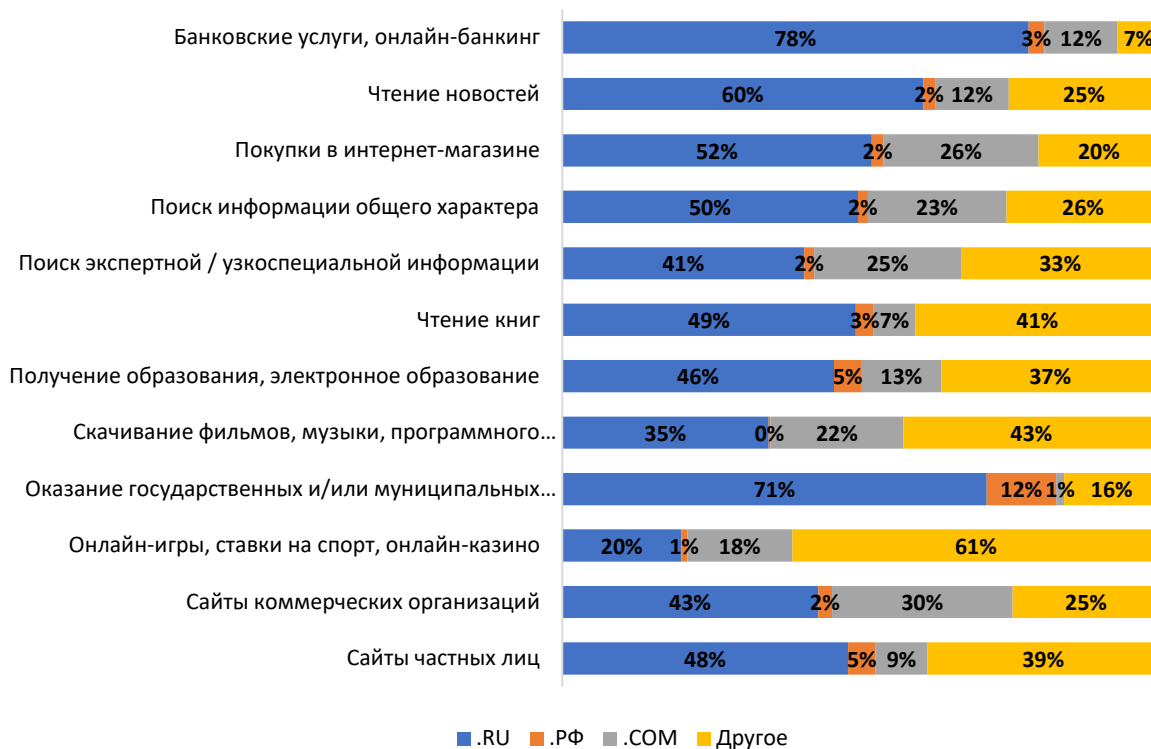
Диаграмма 4: Распределение респондентов по выбору доменных зон при создании или посещении сайтов в различных областях

Среди факторов, важность которых при выборе доменной зоны для регистрации доменного имени отметили респонденты, наиболее значимыми для пользователей являются: наличие свободного доменного имени, соответствие тематике ресурса и доступность по стоимости. Каждый из этих факторов близок более чем 60% респондентов. Второе место делят принадлежность к определенной стране или региону и известность для пользователей, они являются значимыми для 54% и 53% респондентов соответственно.