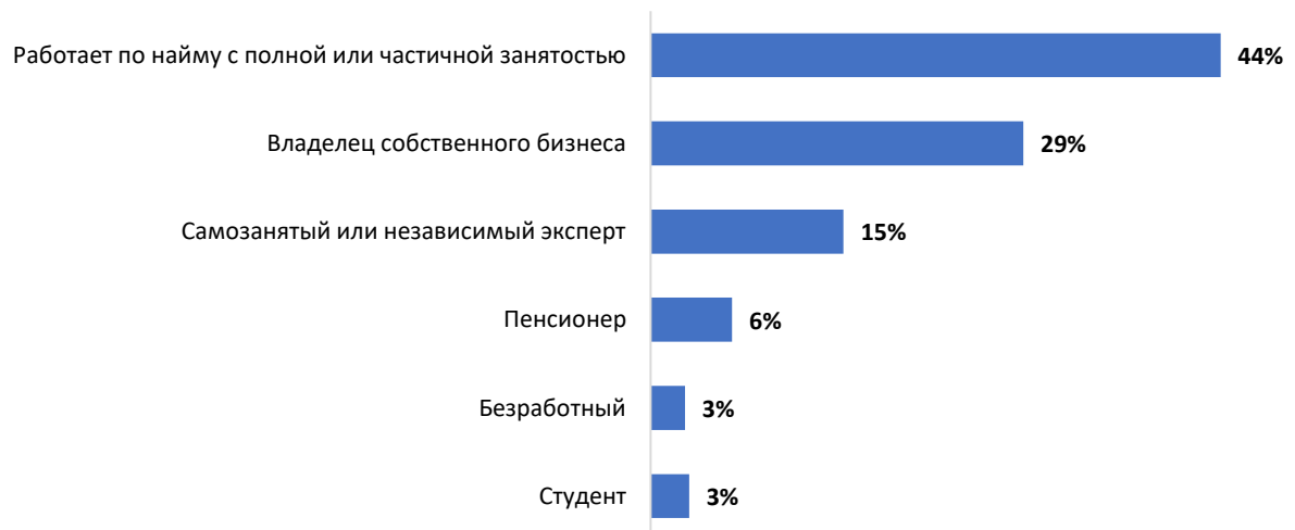
Диаграмма 1: Распределение респондентов по сферам занятости

73% опрошенных работают по найму или являются владельцами собственного бизнеса, 15% - относят себя к самозанятым экспертам, 12% в данный момент не вовлечены в активную трудовую деятельность.